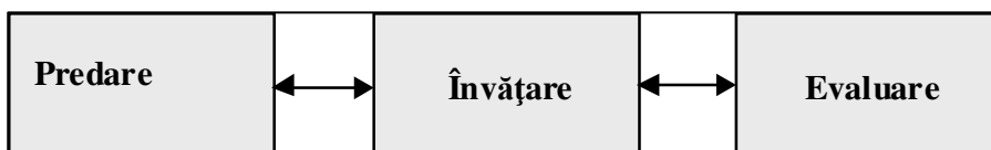
Fig.1. Modelul clasic al procesului de învățământ