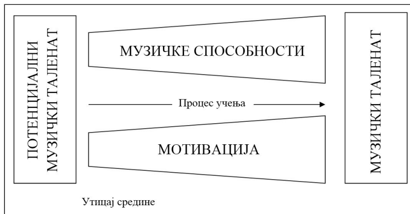
Слика 1. Графички приказ Базичног модела развоја музичког талента