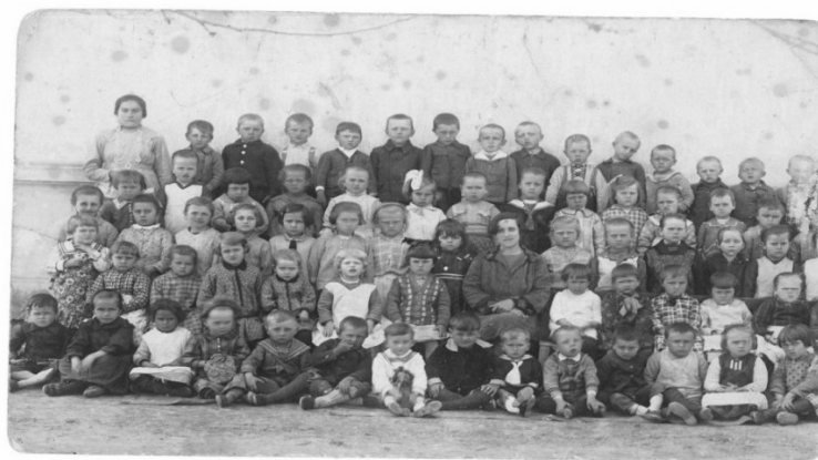
Забавиште у Старчеву, 1928. и 1929. година

Следећи податак на који смо наишли јесте да је 1926. године пододбор „Књегиње Љубице“, у присуству изасланика Министарства социјалне политике из Београда и представника локалних добротворних и хуманих установа, у Панчеву основао обданиште. У овом обданишту боравила су и мушка и женска деца од 5-12 година старости, без обзира на верску припадност. Основни услов био је да су деца југословенског порекла. Исхрана деце је била најважнији задатак, а касније се радило и на обезбеђивању одеће и обуће. Број деце се кретао од 40 до 60, а са њима су радиле учитељице и забавиље.