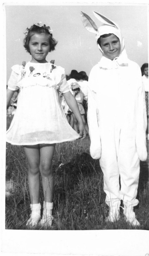
Дечји вртић при основној школи „Жарко Зрењанин“, 1956. година

У годинама које су уследиле, назив установе је остао исти: „Дечја радост“, а друге одреднице су се мењале у зависности од законских решења. Делатност се, такође, није мењала, па се може закључити да се рад са децом предшколског узраста афирмисао и развио тако да се питање постојања самосталне установе више не поставља.