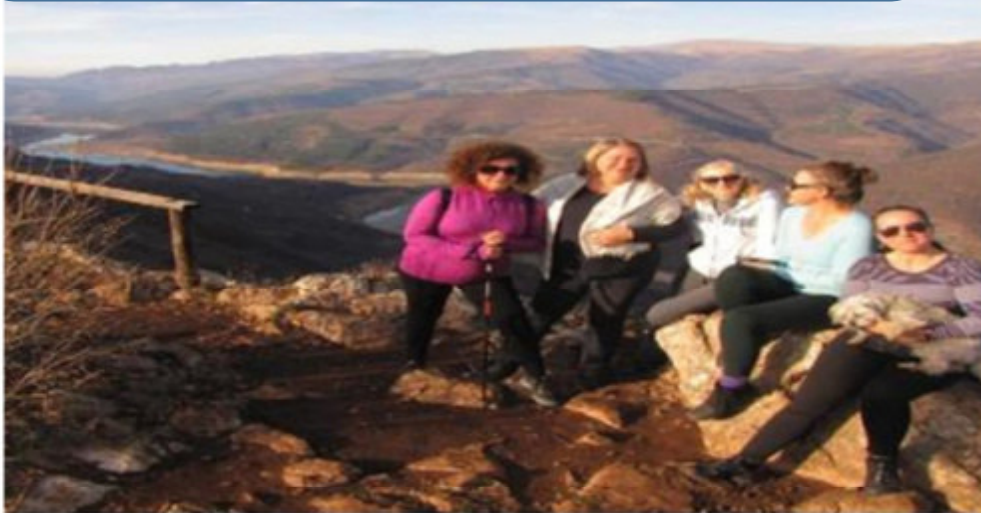
Stara planina-staza iz sela Slavinja vodi do kanjona i duga je oko 3,5km. Šetnja traje oko 1h. 🦶