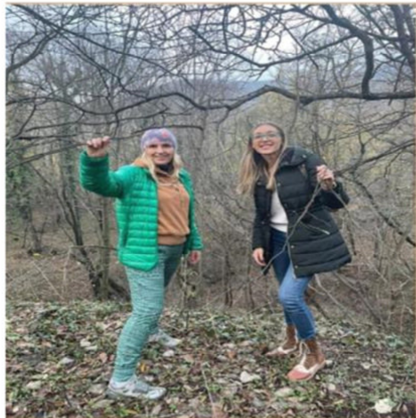
Šetnja u trajanju od 1h, po šumi na vršačkom bregu(Gudurički put). 🦶